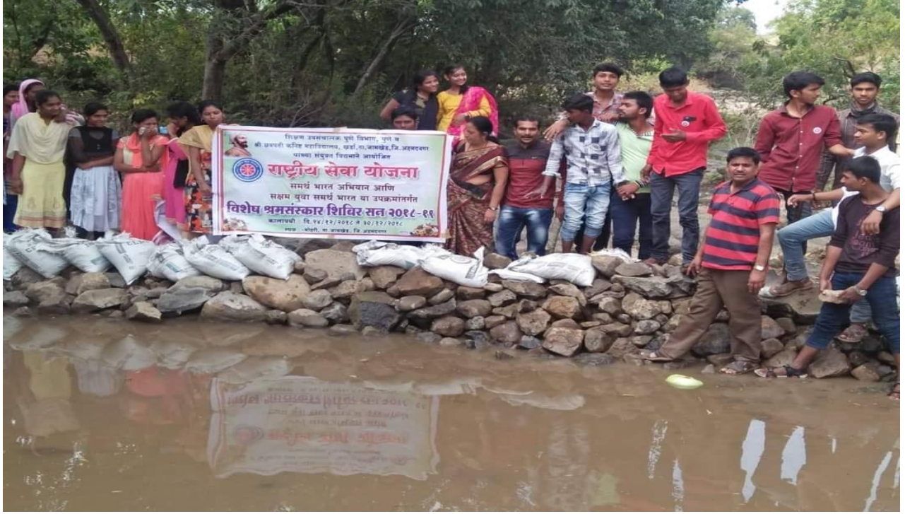
Build Bunds by NSS volunteers