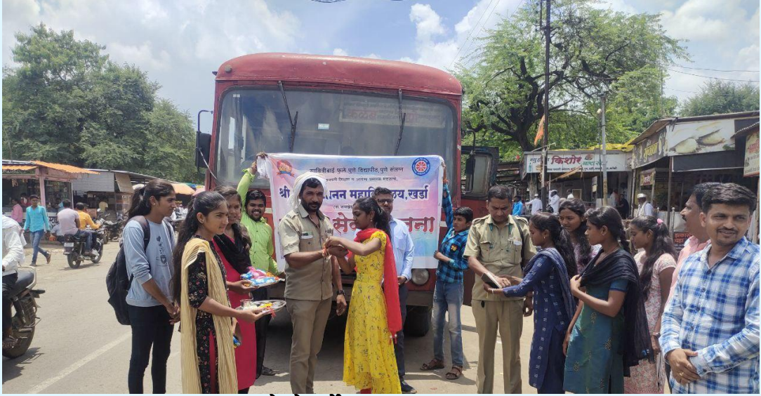
रासेयो तर्फे रक्षाबंधन उपक्रम