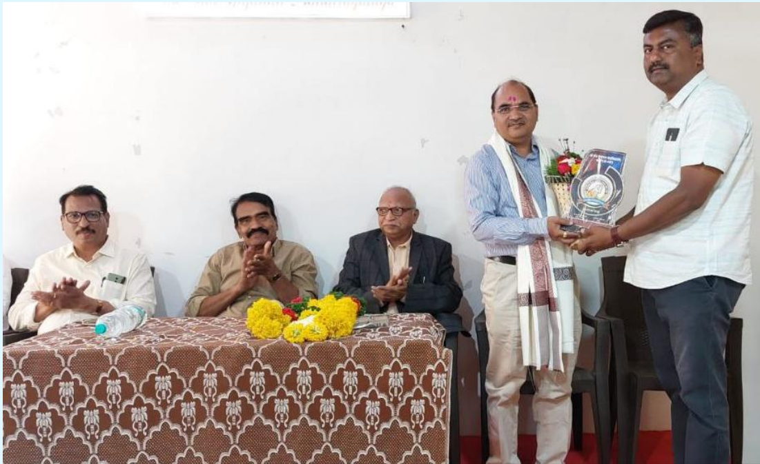
परामर्श योजनेंतर्गत TC कॉलेज बारामतीची समिती, NAAC 'B' दर्जा प्राप्त.