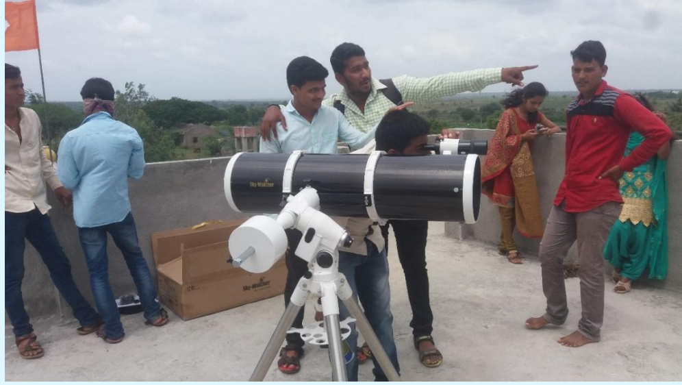
अत्याधुनिक दुर्बिणीद्वारे अंतराळ निरीक्षण