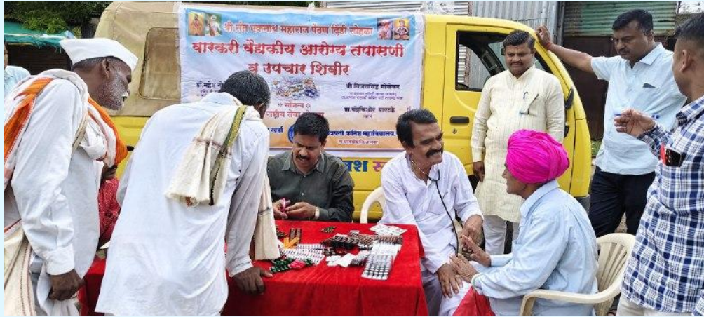
रासेयो च्या वतीने श्री संत एकनाथ महाराज पैठण-पंढरपूर दिंडी सोहळ्यात वारकरी वैद्यकीय आरोग्य तपासणी शिबीर