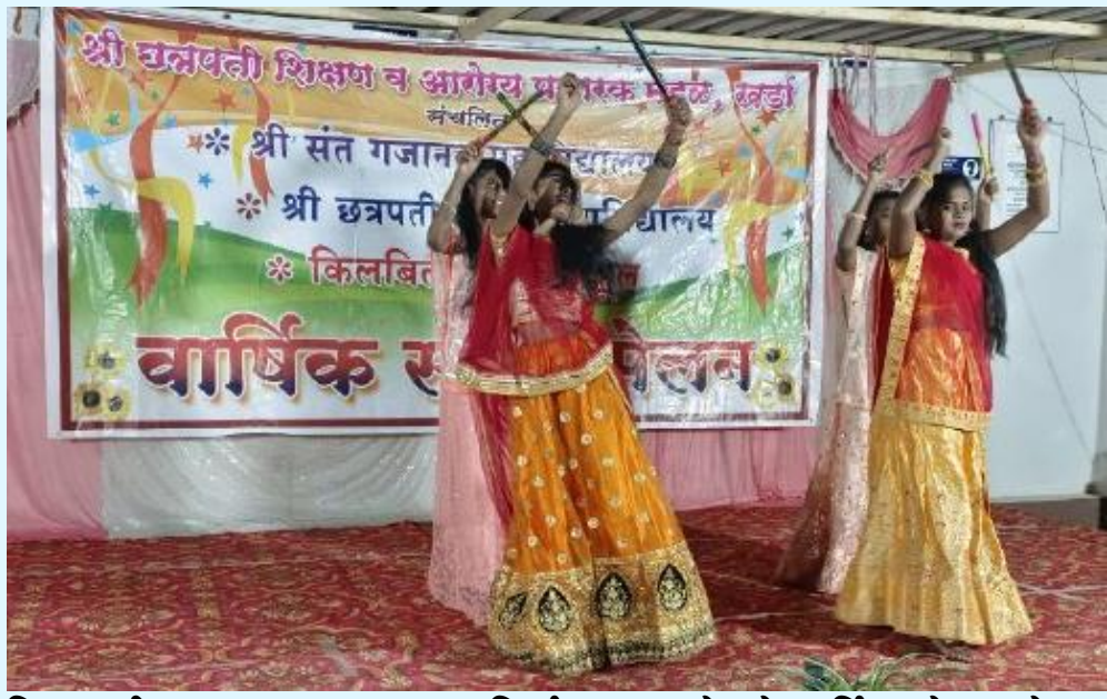
विद्यार्थ्यांच्या कला गुणांना वाव निर्माण करून देणारे वार्षिक स्नेह सम्मेलन